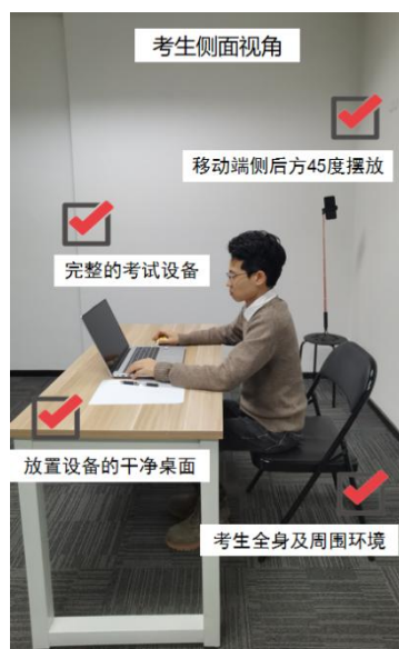
图四：考生侧面视角图