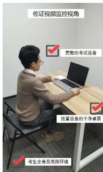
图五：佐证视频监控视角图